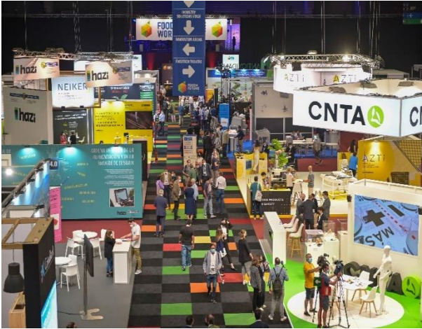
FOOD 4 FUTURE