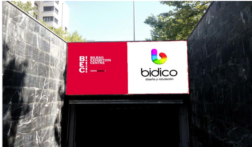
Imagen en portón de acceso a parking

Presente su marca a quienes acuden al certamen en vehículo particular. Nada más acceder al túnel de entrada al parking su marca resaltará con un tamaño de importantes dimensiones.