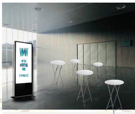
Logo en soporte de cartón zona WMW Awards (tótem)