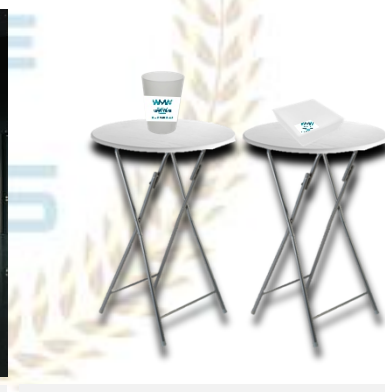
Logoa edalontzi eta eskuzapietan (aukerakoa; ekoizpen-kostu gehigarriarekin)